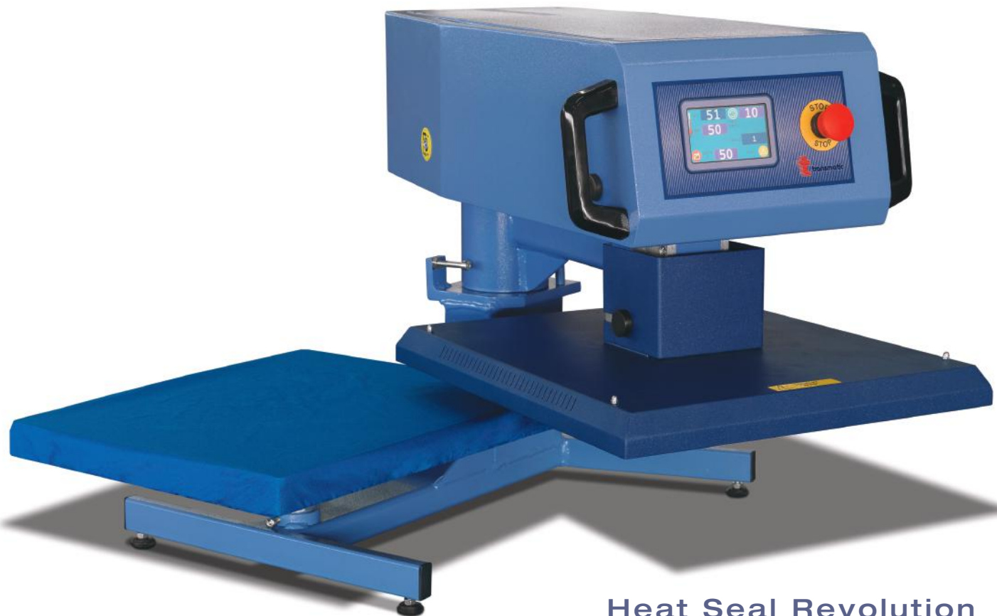
Heat Seal Revolution